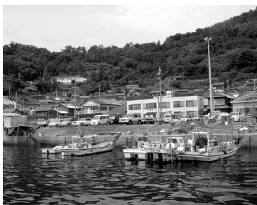
▲上関の景観 瀬戸内航路の要衝として番所が置かれ通信使の休息地だった

資料解説&メモ 当館寄託の「小笠原文庫」には人類の宝とされる「世界の記憶」遺産が含まれています。その遺産は「朝鮮通信使資料」と総称される文化八(一一八一)年に使用された朝鮮通信使(公式の外交使節団)の記録です。江戸時代の日本は「鎖国」して外国との交流は中国・オランダとの交易を除き行われなかったとされますが、唯一の例外が隣国朝鮮との外交でした。將軍の代替わり毎に500人近い使節団が朝鮮から江戸まで派遣され、両国の友好を確認する「將軍一代の盛儀」とされる壮大なものでした。それだけに出費もかさみ問題となっ