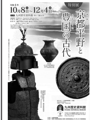
特別展 京都平野と豊国の古代

11月の歴史講座 漢詩紀行講座 11月5日(土) 9時30分 古文書講座 11月12日(土) 10時 古典かな講座 11月19日(土) 9時30分 みやこ学講座 11月26日(土) 10時 ※日程等変更となる場合があります。 ※見学会等は別途通知します。 九州歴史資料館で特別展「京都平野と豊国の古代」開催中! 当館との交流も深い九州歴史資料館では特別展「京都平野と豊国の古代」を開催中です。この展示はかつて「豊国」と呼ばれた京都平野の古代史を「深掘り」するもので、みやこ町の資料も主役の一人となつて貴重な資料が勢揃いします。