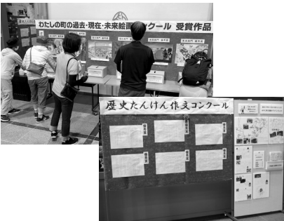
▲審査後の作品展示の様子(写真は令和3年度) 絵画については期間中の有料入館者による投票でグランプリを決定します

◆博物館NEWS 「文化のみやこづくり」記念プロジェクト 絵画・作文コンクール入選作品展示会 会期：10/5(水)〜10/30(日) 場所：博物館ホール 京築の子ども達お気に入りの風景や歴史に関する様々な思いを表現する「文化のみやこづくり」記念絵画・作文コンクール。今年も多くの作品が寄せられましたが、このほど第一次審査が終了し、お披露目準備が整いました。絵画は「わたしの町の過去・現在・未来」と題し、時を超えて愛すべき風景を描き、作文は様々な歴史たんけん(調査研究や取材、感想など)成果を綴っています。右の期間、博物館で展示致します。