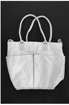
帆布地のトートバッグ

ライト兄弟が世界史上初の有人動力飛行に成功し、来年で120年を迎えます。人類の悲願であった大空への初飛行を成し遂げた飛行機の翼には、軽くて丈夫な「帆布」という布が張られていました。18世紀の日本では、兵庫県で廻船業を営んでいた実業家、工楽松右衛門がこれまでにない丈夫な船の帆「帆布」を開発します。この「帆布」や「帆布」は、いずれも麻や亜麻、綿素材を平織りして作られる厚手の布地で、一般的には「ズック」や「キャンバス」と呼ばれています。この生地は30年ほど前まで、この地域の中学・高校に通う男子生徒の通学カバンに用いられるなど馴染み深いものでしたが、近年は、化学繊維の普及などで消防ホースなどその用途が限られていました。しかし2年前の「レジ袋有料化」に伴い、耐久性