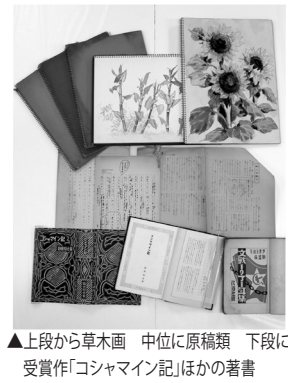
▲上段から草木画 中位に原稿類 下段に受賞作「コシャマイン記」ほかの著書

この展示(と収蔵資料) ココが見どころ、ココがツボ!! ●資料名 鶴田知也資料(つるともやしりま) 1括 ※写真真は資料群の一部 ※現品は一部が堺葉山鶴田顕彰会の所蔵(当館寄託) ●データファイル ・法量等…総数約〇〇〇点(※整理中) ・制作年代…昭和初期(末期二〇)〜九〇年前後 ・ポイント…未発表原稿等を含む資料群で十分な注視・分析が必要 ●公開状況…保存等のため通常非公開