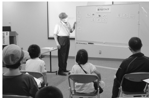
▲会場では先生の昆虫談義に加え「動物と虫の親子あてクイズ」「カブトムシのクラフト制作」など楽しめる学びと発見が満載でした

◆講座・教室・催し物ガイド 10月の歴史講座 【漢詩紀行講座】 10月1日(土) 9時30分 【古文書講座】 10月8日(土) 10時 【古典かな講座】 10月15日(土) 9時30分 【みやこ学講座】 10月22日(土) 10時 ※日程等変更となる場合があります。 ※見学会等は別途通知します。