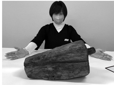
▲国内に2例しかない「木柱」。展示・活用が期待されます。

例年、町内外から多くの見学者が訪れる豊前国府跡公園ですが、解説板の経年劣化に伴う修繕や新たな研究成果を盛り込むことを目的として公園内に設置されている解説板の更新・修繕作業が完了しました。今回は復元されている「築地堀」の解説板も併せて修繕を実施。みやこ町が「大都会」であった頃の様子を楽しく学ぶことができますので是非一度ご覧ください。