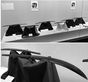
▲整然と並べられた刀剣。壮観です!