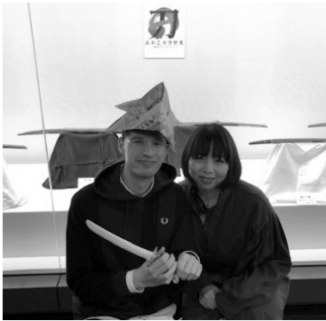
▶フランスからの来館。日本独自の刀剣美に興味津々の様子でした。