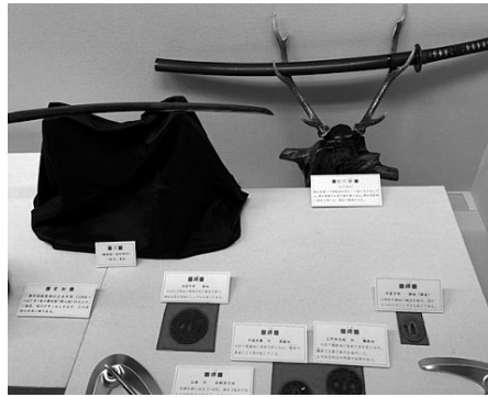
▶外国人に人気の鏢などの刀装具。江戸の彫金師の技術が光ります。