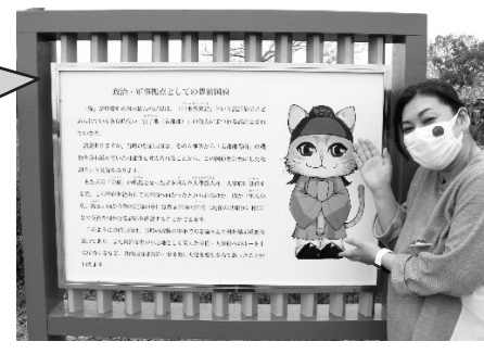
▲更新された解説板。1300年前の「県庁」豊前国府跡について詳しく学ぶことができます。

「国内最古級のダム」のひとつとみられる勝山池田の「池田遺跡」から出土した各種木製品の保存処理が完了しました。「高級アルコール法」という特殊な技法を用いた処理法によって1000年以上前の木材を通常展示・保管することが可能になりました。この中には国内で2例しか発見されていない「木柱」も含まれており、全国的にも注目を集める資料の保存処理作業となりました。