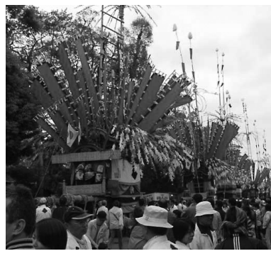
▲過去の実施状況(生立八幡神社山笠)