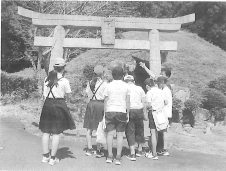
▲古墳前の鳥居にある「女帝神社」の額面に興味深々の様子