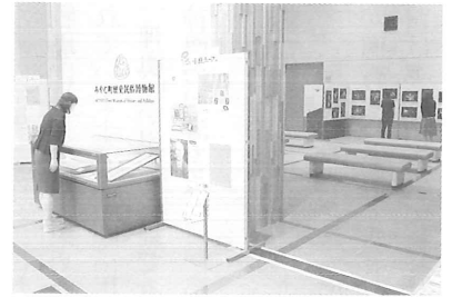
▲開催中のミニ展示の様子 ディスプレイ手前から①いっぴんミュージアム②ささやかギャラリー(左端)③向井澄男ミニ写真展(右奥)