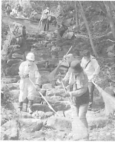
▲蔵持山参道清掃の様子 同山は気軽に登れる里山の霊山として注目されています

文化遺産ボランティアでは、10月4日(日)に蔵持山で清掃登山を行いました。台風の影響等で登山道に枯木や落石が充満していましたが、活動成果で大分歩きやすくなりました。参加いただいた皆さん、お疲れ様でした。