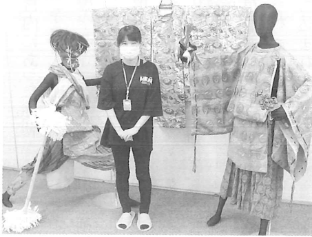
▲昭和初期と見られる神楽装束の確認と着付を終えて一息