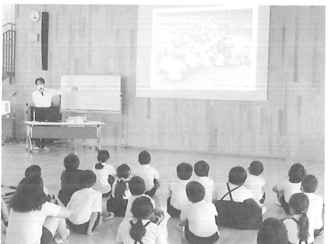
▲学校や住んでいる地域の歴史に驚きの様子でした