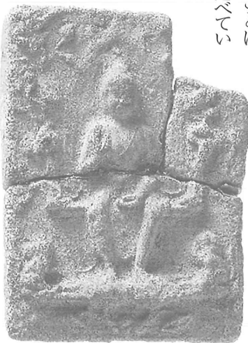
正道遺跡（みやこ町国分）出土博仏