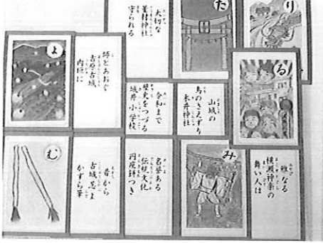
▲カルタ作りを通して改めて故郷のすばらしさを知ることができました