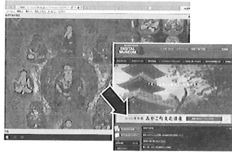
▲胎蔵界曼荼羅図(国分寺所蔵) スタート画面(右)の矢印部分をクリックすると画像へジャンプ