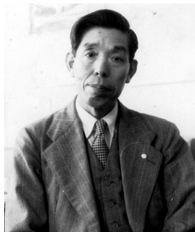
▲島山鶴雄(1906～2005/壮年期肖像)

本展資料は島山氏ご遺族から寄贈頂いた遺品類を中心に殆どが初公開となるものです。ぜひご覧下さい!