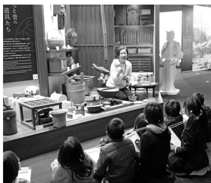
▲ボランティアによる児童向け「むかしの暮らしと道具」ガイド

博物館は郷土資料と学芸員らのサポートによる知と学びの拠点です。以下の会や講座を利用して楽しく学びませんか? 詳しくは博物館まで気軽に問合せてください! ○博物館友の会 バスハイク・歴史たんけんウオーク等の学びの旅に参加できます。 ○文化遺産ボランティア体験講座 町の宝をガイド&ガイドするスタッフを募集・養成する講座です。今からでも町外からでも大丈夫です。