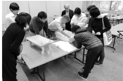
▲この地域の弥生時代の遺跡を見直すきっかけになりました。遠方からの調査お疲れ様でした。

2月6日(水)黒田小学校3年生の32名が「昔の道具」について学習しました。校区内の「黒田エノヲ遺跡」から出土した約2000年前の土器には、現在の技術でも復元できないものも含まれ、当時の技術の高さに驚きの連続でした。