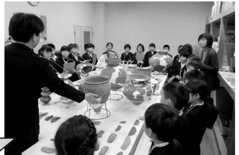
▲校区内の地下から出土した2000年前の道具に興味津々。ご先祖様が使っていたもの?