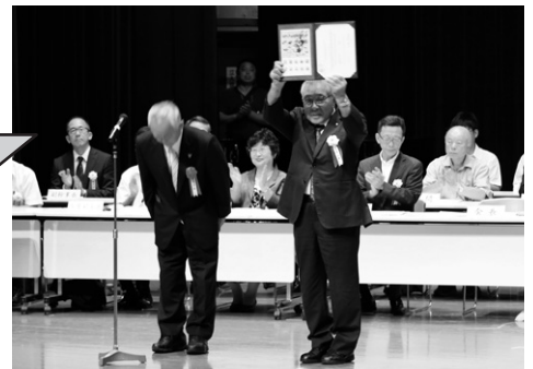
▲渡された認定証を手に、喜びもひとしおの様子の関係者