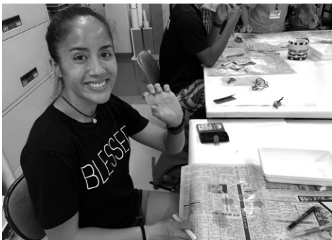
▲古代文化体験で作ったハート型の勾玉にご満悦の様子

9月21日(金)、オセアニア諸国からオリンピックの事前キャンプに訪れた選手一行が博物館を訪れました。みやこ町の文化体験希望に応え、勾玉づくりにチャレンジいただいたところ大変好評でした。