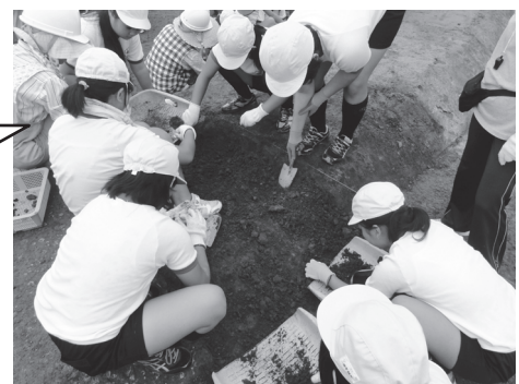
▲約二千年前の土器の破片を夢中で掘り出しました