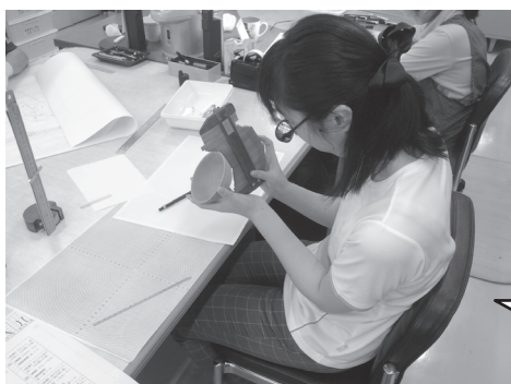
▲調査記録報告書作成のための土器実測にチャレンジ

9月5日(火)～9日(土)まで、梅光学院大学の博物館実習生1名の受け入れを行いました。土器の実測や小学生への学習支援の助手など、博物館が行う様々な業務を体験してもらいました。