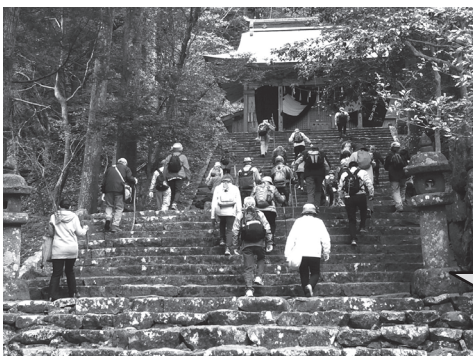
▲求菩提山中宮のワイルドな石段を上る参加者

3月26日(日)、歴史講座・友の会合同で「歴史たんけんウォークin求菩提山」が行われました。御田植祭直前の山はまだ冬の名残姿でしたが、祭を境に春が一気にやってくる雰囲気満々でした。