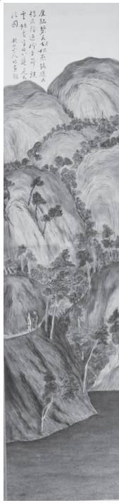
▲左:画幅全体 右:画賛部拡大

ねて画作に熱中し、晩年はプロ級の腕前に達したことは前回ご紹介したところですが、その実力のほどを示すのが本作です。緻密に描かれた山中の伽藍や山水の姿は幻想的で、これに漱石得意の漢詩を賞として書き加えることで芸術としての完成度がより高められています。小説ではリアリティを追求した「写生文」的作品を創作し続けた漱石は、非写実で幻想的な南面を「でたらめが描けるのでいいじゃないか」と、画作の師と仰いだ門弟津田青楓に語っています。 漱石は小説とは真逆の世界観が広がる絵を描くことで、現実世界とのバランスを取っていたのかもしれない。