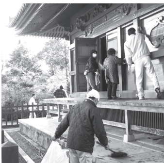
▲友の会活動の一部:年末恒例行事「三重塔す払い」。こんな行事を含め楽しくやっています