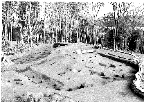
▲三ツ塚古墳群（方墳）発掘調査状況

三ツ塚古墳群は、馬ヶ岳の南東側の丘陵尾根上に位置する古墳群です。直径二〇m規模の円墳三基と同規模の方墳一基からなる古墳群ですが、昔から三基の円墳が目立っていたことから、「三ツ塚」という地名（小字）が付けられたのでしょう。四基