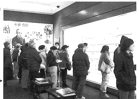
▲参加者は新展示に興味深く見学されていました