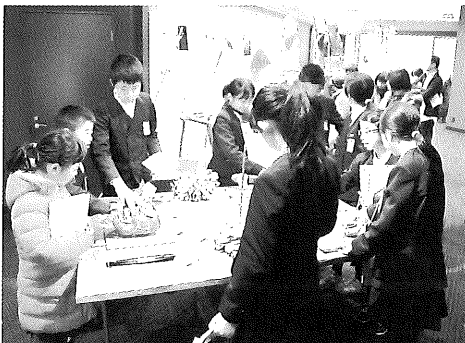
▲地元の霊山・蔵持山のコーナーは特に熱心に見学

1月17日(日)、博物館展示室で新常設展示の説明会「ギャラリートーク」が行われました。リニューアルに伴い内容を一新した常設展示について学芸員が解説するもので、多くの方の参加をいただきました。