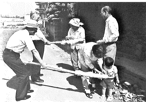
▲菅原神社「九日祭(くんちまつり)」の餅配り(みやこ町節丸) 平成3年撮影