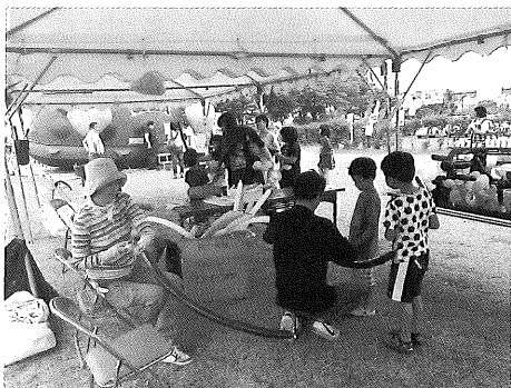
▲まつり会場でのモノづくり体験「パルーンアート」

6月8日(日)、豊前国府跡公園で第3回豊前国府まつりが開催されました。会場内はステージ発表やモノづくり体験、国作区や博物館友の会の出店で大いににぎわいました