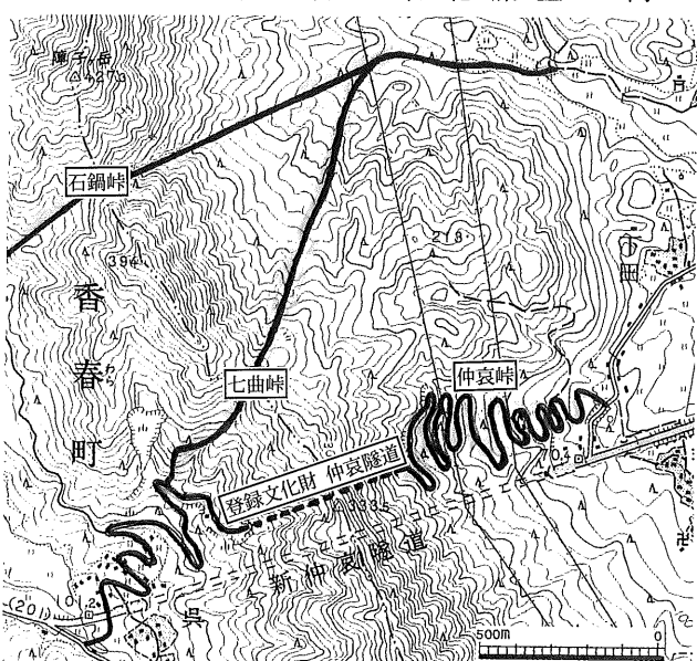
▲仲哀隧道と周辺の峠(国土地理院1/25000図「行橋」より作成)

のことを次のように記しています。「鏡山村を過行ば、其東に、七曲とて高き嶽あり、東西上下の坂、凡一里ばかりあり、其山上は田川京都両郡の境なり、山上より東北の方、海陸の詠めいとよし、山の東は京都郡なり」