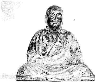
▲凛々しい求道の青年僧姿の八幡神坐像像

ただ実際の歴史が確認できるのは平安時代からで、中世以降仲津郡(現在の行橋市とみやこ町の南部)の大社として領主の参拝が行われる格式高い神社とされてきました。