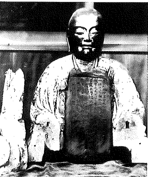
▲胎内には銘文が刻まれています

していましたが、明治のはじめにその役割を終え、現在は傍らで休憩されているような状態です。その休憩中をお邪魔して恐縮ですが、特徴あるお姿を皆さんに理解いただくため少しだけお付き合いいただくこととしましょう。