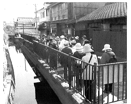
▲現地での説明に聴き入る参加者(舟路川)

3月23日(日)、博物館友の会と博物館金曜古文書講座合同で、「歴史たんけんウォーク～在郷町・大橋ウォーク～」が実施されました。今回のウォークは、江戸時代に小倉藩屈指の経済力を誇った町「大橋」(現行橋市)の歴史を学ぶことを目的に実施したものです。公民館で当館学芸員のレクチャーを聴いた後、旧道を歩きながら往時の繁栄に思いをはせました。