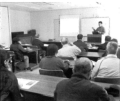
▲事前レクチャー(行橋市中央公民館にて)

3月23日(日)、博物館友の会と博物館金曜古文書講座合同で、「歴史たんけんウォーク～在郷町・大橋ウォーク～」が実施されました。今回のウォークは、江戸時代に小倉藩屈指の経済力を誇った町「大橋」(現行橋市)の歴史を学ぶことを目的に実施したものです。公民館で当館学芸員のレクチャーを聴いた後、旧道を歩きながら往時の繁栄に思いをはせました。