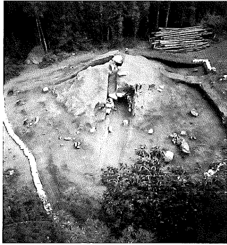
▲清地神社南古墳群(勝山長川)