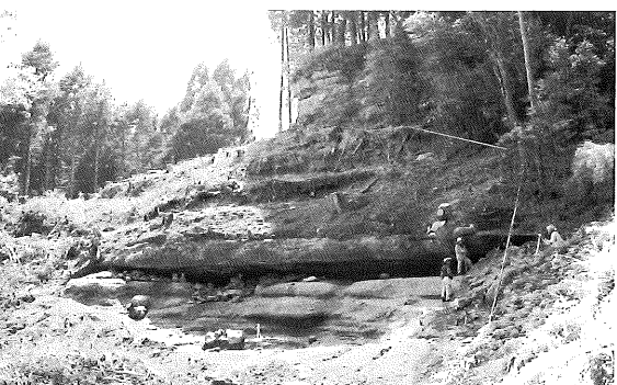
▲岩窟に営まれる墳墓(中世/蔵持山修験道遺跡)