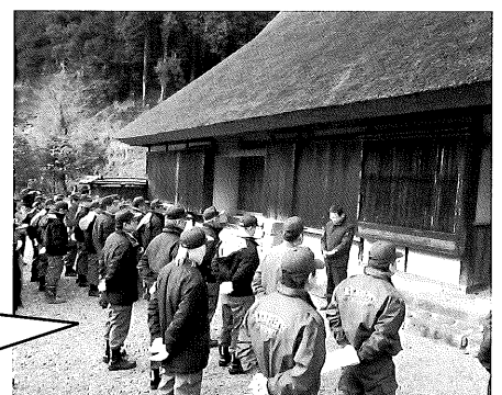
▲文化財防火点検式 開会行事

1月26日(日)、みやこ町犀川帆柱の国指定文化財「永沼家住宅」において、文化財防火点検式が行われました。これは、国の定めた「文化財防火デー」にあわせて行われたもので、京築広域圏消防本部京都分署、みやこ町消防団及び永沼家住宅保存協力会の皆様にご協力をいただき、点検放水等を行いました。