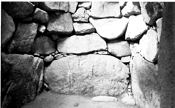
▲横穴式石室の内部(古墳時代/清地神社南古墳群)

※注:整理調査とは発掘調査後に行われる出土資料・情報の整理と学術報告書の作成作業を指します