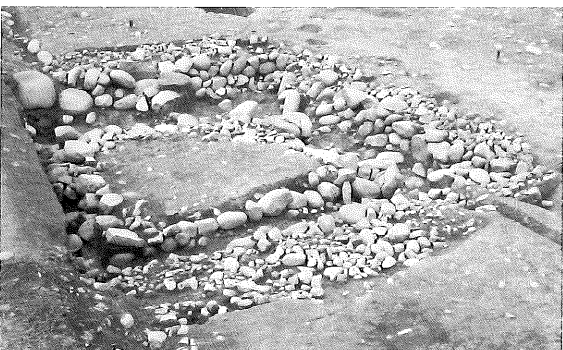
▲旧水神祠の基壇跡(近世~/皆見中園遺跡)