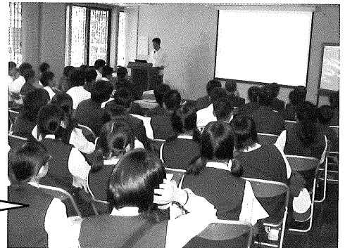
▲博物館研修室で「育徳館の歴史」学習