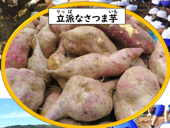
りっぱ 立派なさつま芋