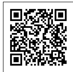
【サポートメニュー】