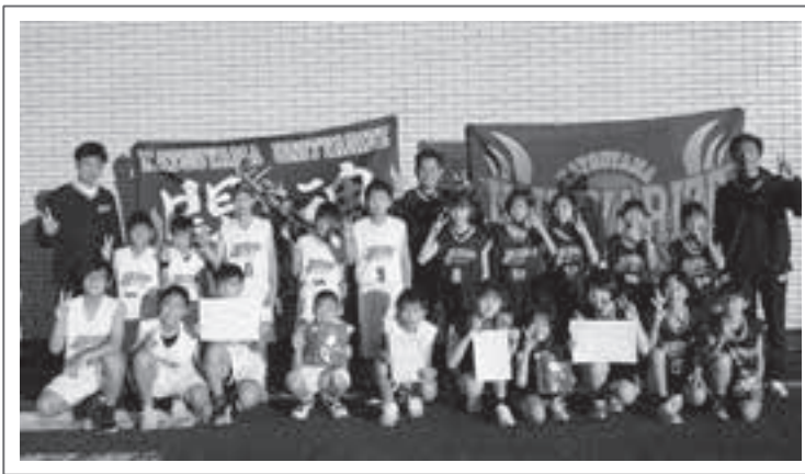
男子の部 準優勝 勝山ユニティ アライズ 女子の部 準優勝 勝山ユニティ アライズ