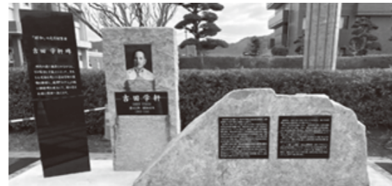
移設された「吉田学軒顕彰碑」

100 周年の「昭和の日」に町の先人の功績や生涯に思いを馳せてみてはいかがでしょうか？