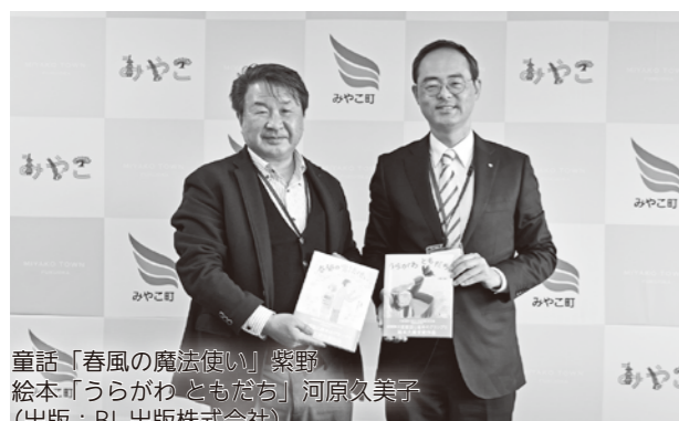
童話「春風の魔法使い」紫野 絵本「うらがわ ともだち」河原久美子 (出版：BL 出版株式会社)

今回は、サポーターが「認知症サポーター養成講座」を受講しました。本人ができることを奪わずに生活を工夫し見守ること、それが、自分が認知症になっても暮らしやすい町づくりにつながることを学びました。