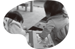
手作りセンサリートイ