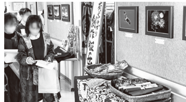
(おらが町に来て見てギャラリーの展示)

★みやこ町地域活性化協議会 ～イベントを通じた地域の活性化～ (令和6年度からゆめづくり事業補助金活用) 豊津地区で7月に「夜市」、2月に「節分祭」を開催。SNSでの広報活動などを積極的に行い、町内外から多くの方が訪れます。祭りには地元の中・高校生ボランティアを募集し、学生が祭りの進行の一部を担う部分もあり、楽しむだけでなく、教育の場にもなっています。