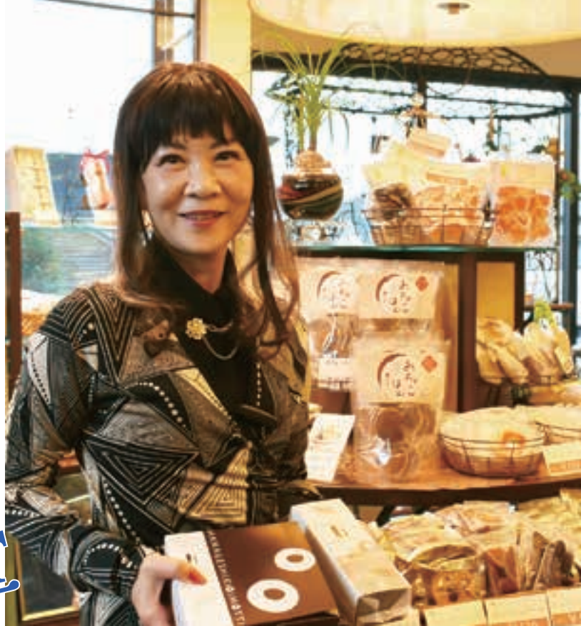
(株) 花げしき 代表取締役