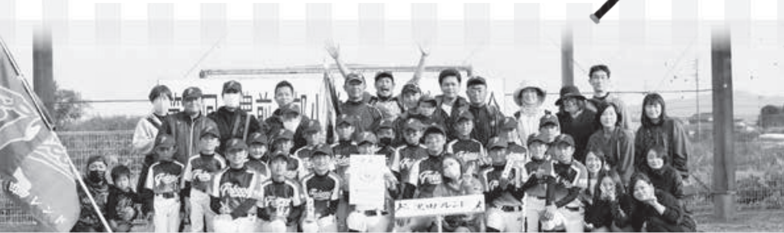
第 9 回豊前近郊小学生ソフトボール大会にて

「放課後等デイサービスのどか」とは、就学中の6歳～18歳までの障害のあるお子さんや発達に特性のあるお子さんが、放課後や夏休みなどの長期休暇に利用できる施設です。