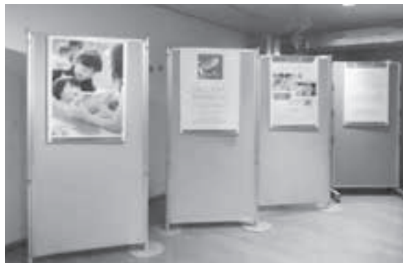
ブックスタートパネル展 実施中 中央図書館で31日④まで