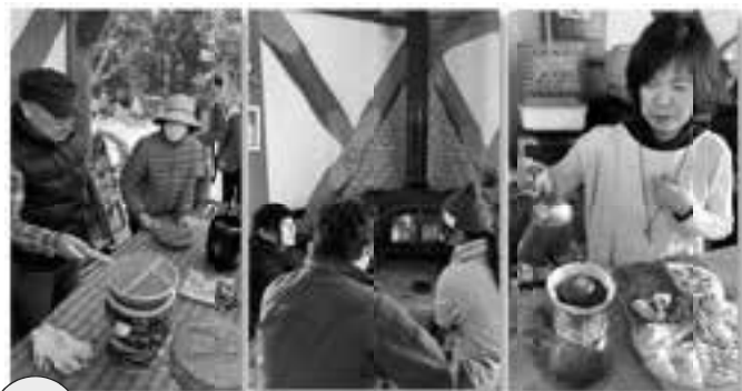
3/17 ㊦ パン工房 麦の穂 デイキャンプ体験 ~焚き火を囲んで~

素敵なインテリアのカフェでパンもいただけます。 ■ラヴィアンローズ (090-3416-2177) 営業日 (金・土)