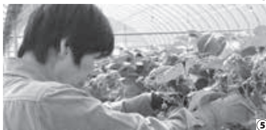
①6次産業化の成功例「えふ」②果樹育ては子育てと一緒に話す松木さん③来園者のために植えたしだれ梅④⑤新たな試みのイチゴ狩り。ここでも女性が活躍している