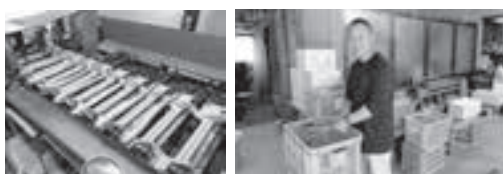
▲収穫の様子。ハウスも増え、収穫する野菜の種類も増えた。