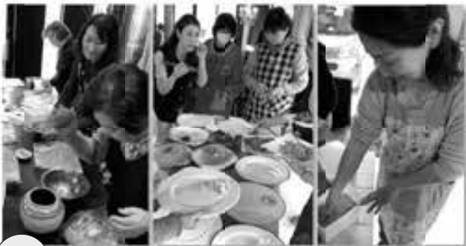
3/14 ㊦ ラヴィアンローズ 健康で美味しい食の提案 ~発酵・味噌編~

ラヴィアンローズさんの人気の発酵シリーズ。今回は原材料にこだわった味噌作り体験を行いました。ランチは、味噌を使ったお料理をいただきました。