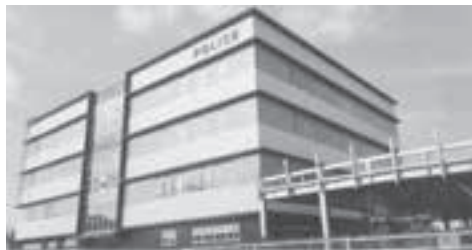
▲新庁舎で免許更新ができます！