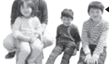
◀子どもたち。子どもたちに自分が作った野菜を食べてもらいたいという思いも叶えられた