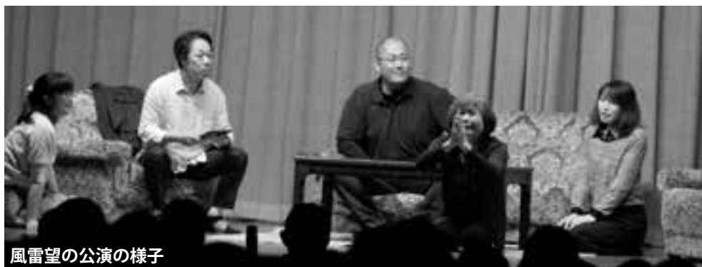
風雷望の公演の様子

10月26日に中央公民館で開催された認知症あんしんフェアでは、認知症をテーマにした作品を募集しました。応募作品の中から、作文の部最優秀賞の作品を紹介します。