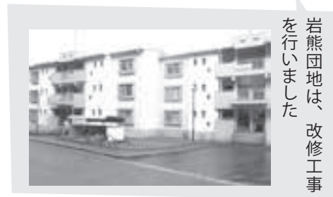
岩熊団地は、改修工事をいたしました