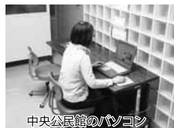
中央公民館のパソコン