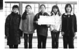
京築ブロック3位 「若竹子子ども会」