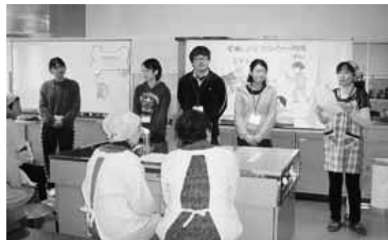
食進会中央研修会の様子

私たち食進会はご希望があれば出向いて行きますので、いつでも気軽にお声をかけてください。