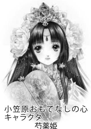
小笠原おもてなしの心 キャラクター 芍薬姫