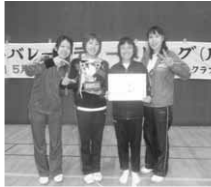
レディースの部優勝 アルデンテチーム