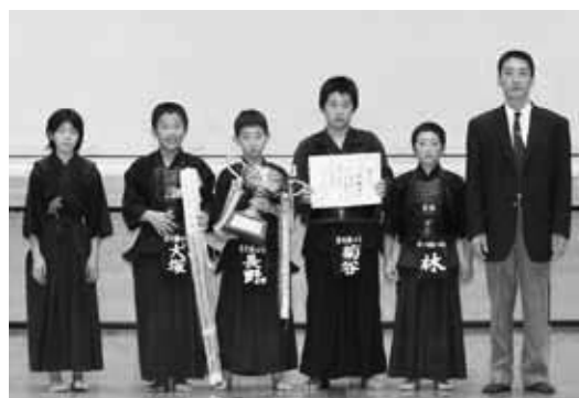
小学生団体の部優勝 犀川練心館 A