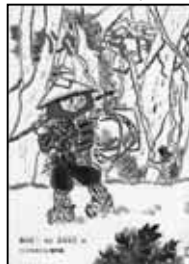
瀬田貞二 再話 赤羽末吉 画

むかしむかし あるところにびんぼうな じいさんとばあさんがすんでいた あるとしのおおみそか、じいさんはあみがさを こしらえ、まちにうりにでかけた でも、あみがさはうれず、ゆきもふってきた かえるとちゅう、ふぶきにさらされたじぞうさまに あみがさをかぶせてあげた すると、しょうがつのあさにふしぎなことが