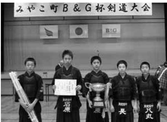
中学生団体の部 優勝 育徳館中学校