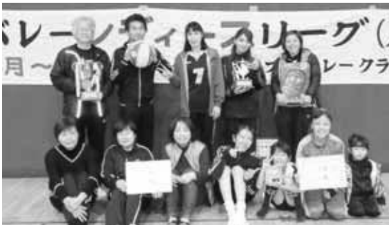
リーグを制覇したぎんが、アルデンテチーム