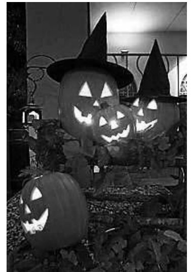
ハロウィーンズのジャックランタン

来月はアメリカのお正月の話をしてします。それではまた！ (日本語訳 ALT サラ・ホール)