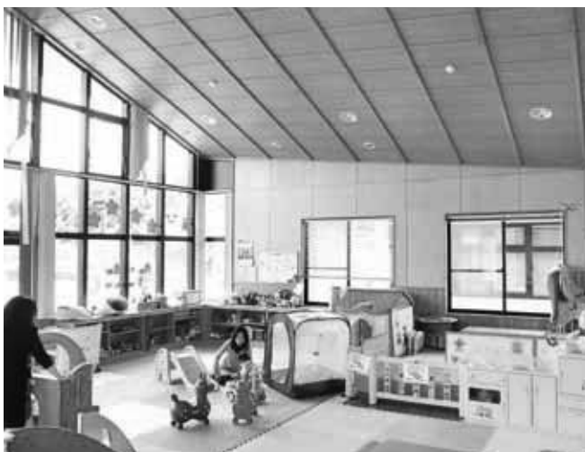
(みやこ町子育て支援センターいこいの里内)