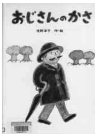
佐野洋子作・絵講談社(1992)