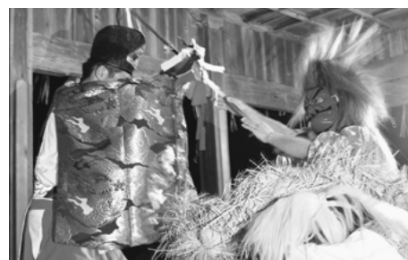
土屋神楽講（吉富町）