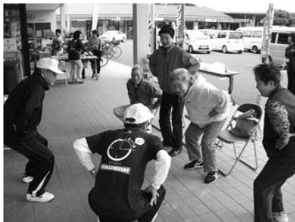
勝山地区での様子

このチャレンジデーが「住民の皆様の健康増進」に繋がるイベントとして、今後も定着していけるように実行委員一同努力致します。皆様のご参加、ご協力、大変ありがとうございました。