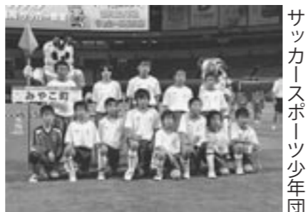
サッカースポーツ少年団

ドッジボールには、諫山小・久保小・祓郷小合同チーム、サッカーには犀川・豊津サッカースポーツ少年団がみやこ町から代表として出場し、激しい戦いを繰り広げました。