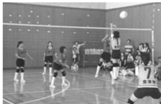
熱い熱い戦いが繰り広げられました!