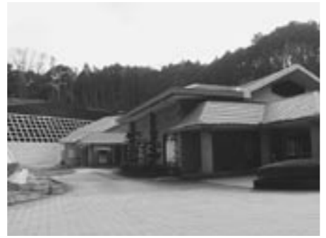
町営葬斎場やすらぎ苑

しかし、厳しい財政状況の中、少子高齢化や地方分権の推進、益々多様化する行政需要への対応などまだまだ課題は山積しています。更なる職員数の削減や徹底