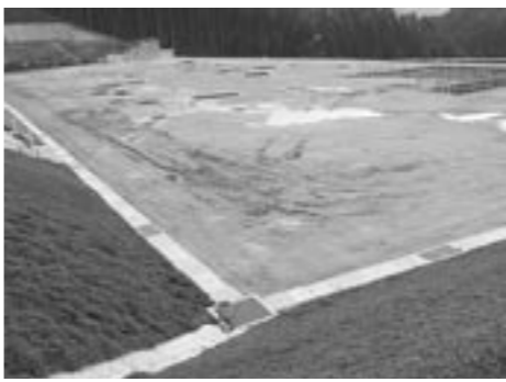
学校ほか公共施設が建設されるB代替地

また、京築田川地区水道水の水源としても期待されている伊良原ダム建設事業につきましては、集団移転地の造成工事も完了し、付替国道496号線の工事も