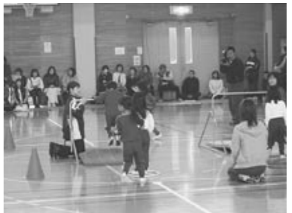
レッツゴーサーキット、鉄棒の様子

園児のみんなは、リズムに乗って体操をしたり、鉄棒や跳び箱、リレー等を元気一杯に頑張りました！