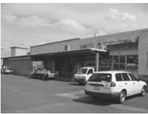
町内にある第2給食センター

たしながら、更に三者の強い連携のもとに諸課題の解決を図り、「特色ある活力に溢れた学校づくり」を推進していかねばならないと考えています。