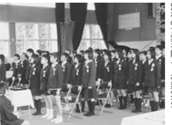
別れの言葉を贈る、卒業生たち

お父さん、お母さんに手を引かれ入学した子どもたちも成長し、通い慣れ親しんだ校舎を後に、新たな希望を胸に中学生になります。