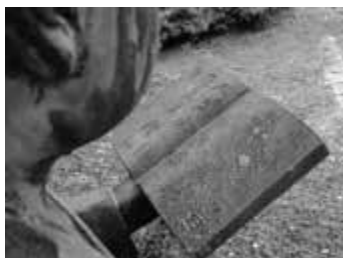
集会所付近にある、二宮金次郎像を上からちょっとのぞき見・・・