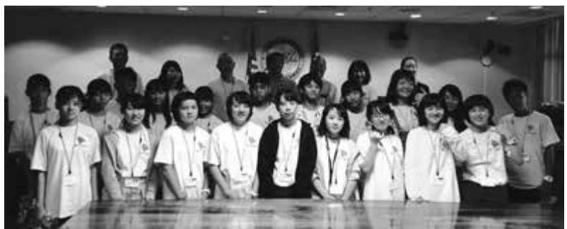
ハワイ郡議会での記念撮影