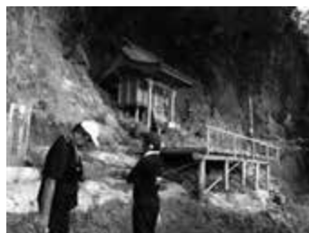
お社到着!パワーをいただきます。