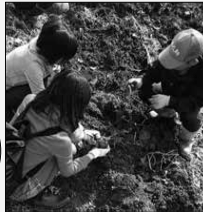
さつまいもがどんな風に出ているのか、子供たちは興味しんしんです♪