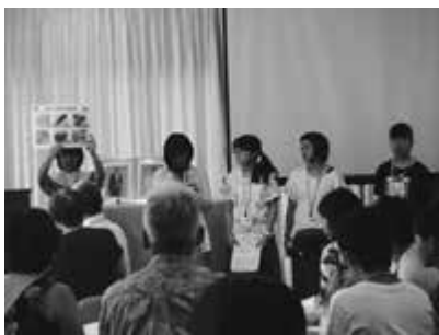
在ホノルル日本総領事館での発表の様子

また、ホノルルの福岡県人会 の皆様も交え、お互いに質問し 合うなどの交流の時間を持つこ とができました。海外で活躍す る日本人・日系人がたくさんい ることを知り、とても刺激にな りました。