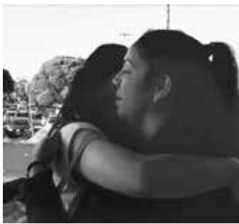
ファミリーとの涙の別れ

ついにホストファミリーとお 別れの日がやってきました。研 修生たちは「帰りたいくない」「寂 しい」と、名残を惜しみながら ヒコを出発しました。