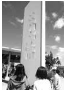
真珠湾のアリゾナ資料館を見学

○待ちに待った出発の日 午後から出発式を行い、ハワイに向けて飛び立ちました。日付変更線を越えてもう一度23日の朝を迎えます。ホノルル空港に到着し、いよいよアメリカへ入国。事前研修でたくさん練習したおかげで、英語での入国審査も無事クリア！ ホノルルでは真珠湾を見学し、戦争の悲惨さを学びました。