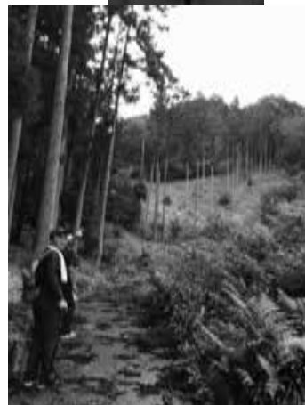
お社まで急な坂道を登ります。