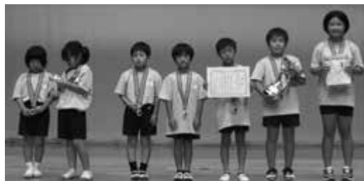
小学生の部（低学年） 城井フレンドリー

小学生の部（低学年） 優勝 城井フレンドリー 小学生の部（高学年） 優勝 コンビ WEST 中学生の部 優勝 犀川中学校野球部 一般の部 優勝 ミラクルハッピー シニアの部 優勝 健康づくり協力員