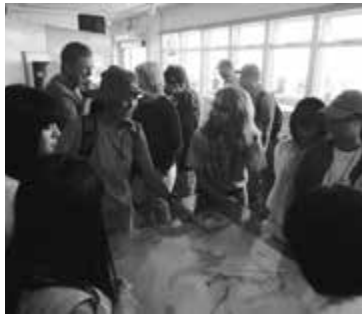
ボランティアガイドによる説明

初めに、ビジターセンターを訪れ、ハワイ島の成り立ちや火山活動について学びました。博物館ではボランティアガイドによる説明を聞きました。