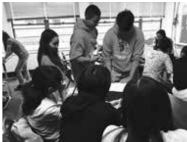
日本語を学ぶクラスで交流

その後研修生による出し物を行いました。バルーンアートや二人羽織、○×クイズ、福笑い等どれも大盛り上がり。練習してきた英語での説明が伝わったときは達成感にあふれました。