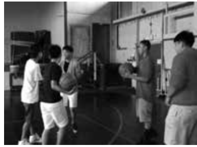
現地の学生とバスケット対決！

その後研修生による出し物を行いました。バルーンアートや二人羽織、○×クイズ、福笑い等どれも大盛り上がり。練習してきた英語での説明が伝わったときは達成感にあふれました。