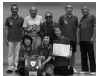
小学生（高学年）コンビ WEST 中学生 犀川中学校野球部 一般 ミラクルハッピー シニア 健康づくり協力員