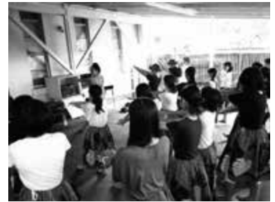
フラ体験！先生は日本人留学生！

昼食は学校の食堂でいただき、午後はフラを体験しました。スポーツ同様、ダンスも言葉の壁を超えるようで、とても楽しい交流ができました。