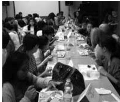
ウェルカムパーティーの様子

ティーで熱烈的な歓迎を受けました。いよいよホームステイの始まりです。研修生はそれぞれのホストファミリーの家へ帰っていききました。