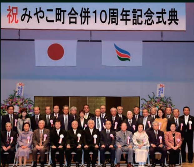
10周年記念式典で表彰者の皆さんと記念写真