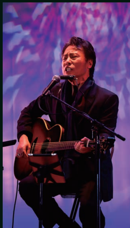
永井龍雲コンサート

20日はサン・グレートみやこで合併10周年記念式典を行った後、犀川支所広場で「第2回みやこジビエSAI」、犀川体育館で「みやこミュージックストリート2016」が開催されました。山下洋輔氏のジャズと大橋純子氏の迫力ある歌のコラボレーションに、会場は酔いしれました。