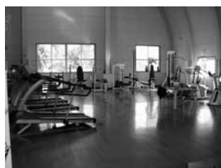
豊津トレーニングセンター