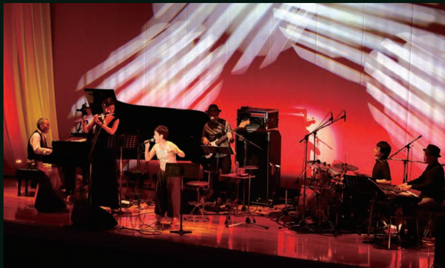
みやこミュージックストリート2016