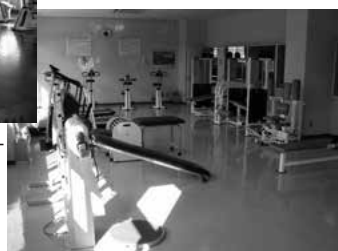
犀川体育館内トレーニングルーム