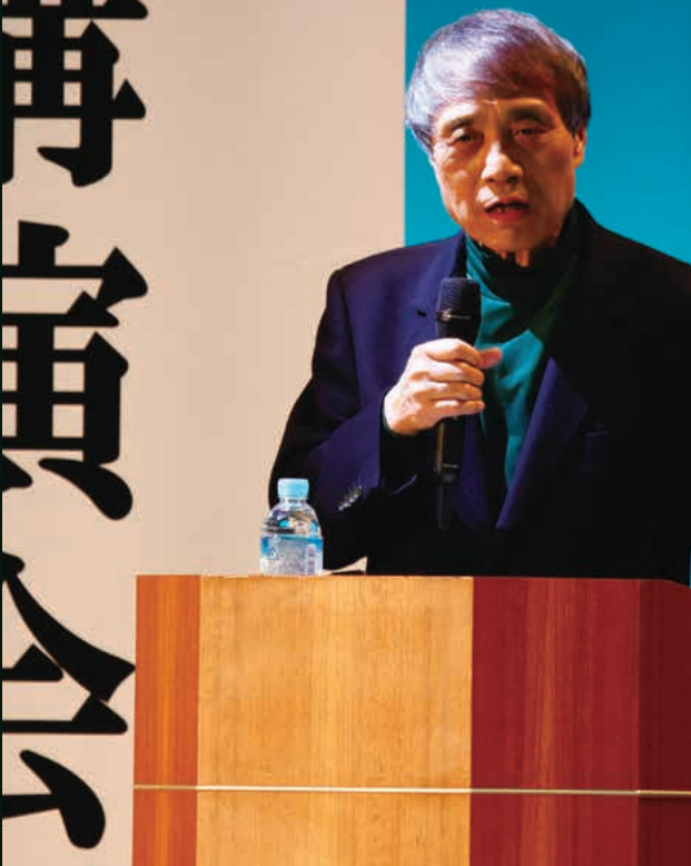
安藤忠雄講演会「地方都市の生き残りをかけて」