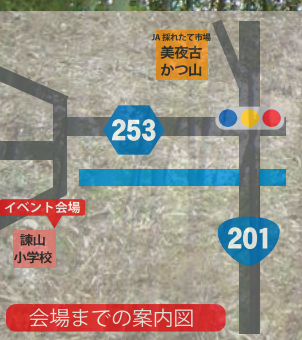
会場までの案内図