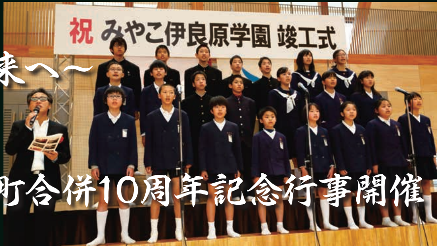
みやこ伊良原学園竣工式で学園ソング披露