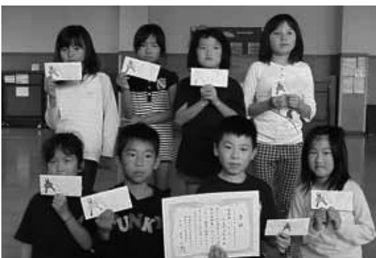
準優勝した上久保子ども会