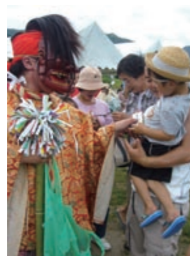
↑横瀬神楽の鬼に会場は大盛り上がり

7月16日、ほたるの里公園で横瀬ふれあいまつりが行われました。このまつりは、ホテルの飛び交う里を守り地元をPRしようと、横瀬地区のみなさんが開催しているものです。今年は北九州市ほたる館の協力のもと、ホテルの幼虫約2,300匹を配布。空手や神楽が披露されたほか、ヤマメのつかみ取りも行われるなど、会場はたくさんの人でにぎわいました。