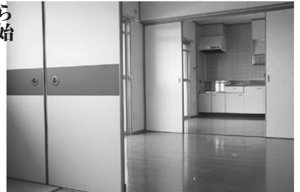
写真は小長田団地6棟32号室の室内です