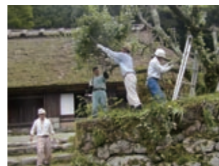
↑清楚な佇まいを取り戻した永沼家住宅。作業に協力してくださったみなさん、お疲れ様でした。

7月23日、犀川帆柱にある重要文化財永沼家住宅で同住宅保存協会などによる一斉除草が行われました。夏休みを迎え見学者も増すこの時期、所有者だけでは手がいき届かない広い邸内の除草を有志たちの協力で、見学者に気持ちよく観覧してもらおうと、例年実施しているものです。