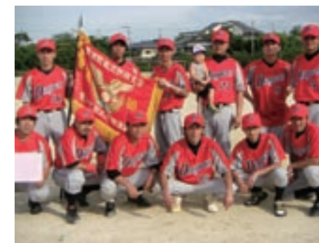
↑軟式野球夏季大会、ドンゴロス優勝

7月16日、ほたるの里公園で横瀬ふれあいまつりが行われました。このまつりは、ホテルの飛び交う里を守り地元をPRしようと、横瀬地区のみなさんが開催しているものです。今年は北九州市ほたる館の協力のもと、ホテルの幼虫約2,300匹を配布。空手や神楽が披露されたほか、ヤマメのつかみ取りも行われるなど、会場はたくさんの人でにぎわいました。