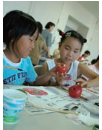
7月27日にサン・グレートみやこで夏休みチャレンジ教室が開催