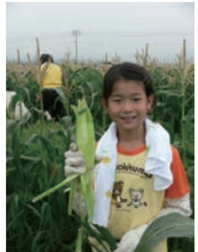
7月23日に開催されたJA福岡勝山主催のスイートコーン狩り