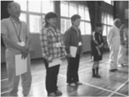
↑5月8日に行われた「豊津寺子屋開講式」子どもたちを見守る有志指導者たち（豊津小学校）

団塊世代の多くが退職を迎える2007年。現在では、『2007年問題』として新聞などで報道されています。しかし、実行委員会は団塊世代を指導者として迎え入れることにより、熟年者の生き甲斐や活力を活用することに着目しました。ここで、注意すべき点には、誰も彼も指導者にはなれないということ。指導者は推薦制によって発掘、そして研修の受講を義務化し、指導資格の認定があるところ。す。