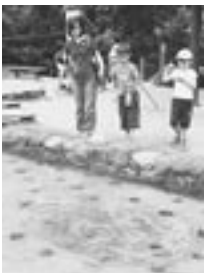
↑ヤマメ釣りをする子どもたち(昨年の風景)