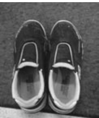
↑講堂などを利用する子どもたちは必ず靴をそろえます。細かい指導が行き届いています。