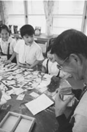
↓カルタで遊ぶ児童と有志指導者