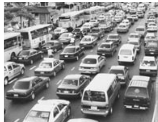
バンコクの交通渋滞

「Crikey」は驚きを表す言葉です。カタカナで書けば上記の通りになりますが、オーストラリアの英語発音の場合は「クローキー」の方が近いです。「すごい…信じられない」というような時に一度使ってみてください☆