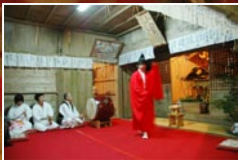
↑扇谷神楽（帆柱大山祇神社）