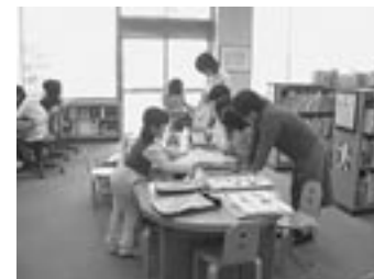
職員によるおはなし会(上) 布の絵本の展示(下)