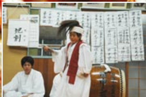
↑横瀬神楽（横瀬公民館）