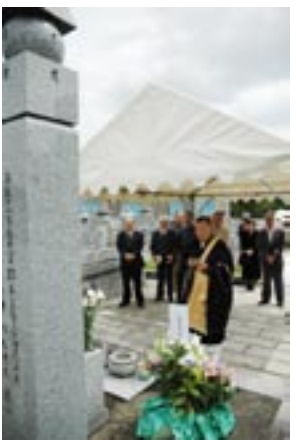
↑甲塚にあるお墓で供養

故郷を思う純真さを語り継ごうと15年前から郷土史会が命日の5月1日に墓前祭を開催するようになりました。この経緯から今では、会津若松市と交流が生まれ、会津若松市の郷土史家から柿が届き、供養祭に墓前に供えています。