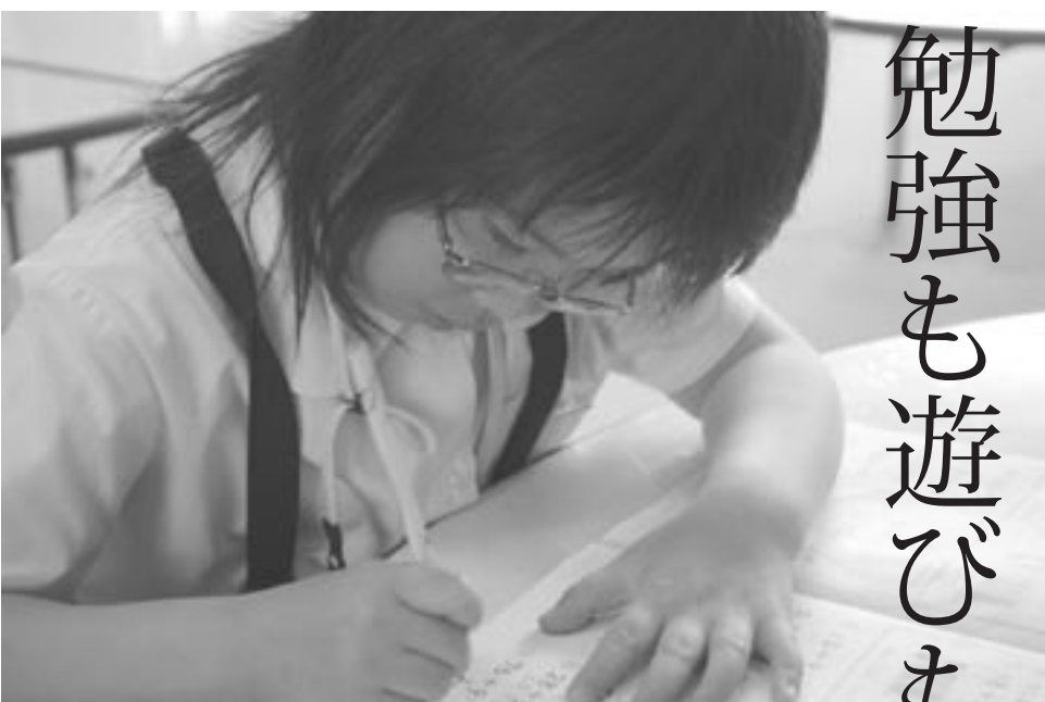
↑祓郷小学校で寺子屋前に宿題に励む児童