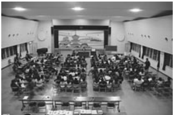
↑4月11日に開催された「豊津寺子屋説明会」

平成14年度に旧豊津町で男女共同参画社会まちづくり懇話会が発足。翌15年度には豊津町男女共同参画行動計画実行委員会が立ち上げられ、子育て支援のための相談事業を実施しました。そして懇話会発人は計48%にとどまりました（最低は韓国の19%）。育児に関して「3歳までは保育所を利用せず、母親が世話をすべき」という意見にと夏休みだけ開設。