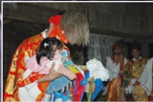
↑下伊良原神楽（下伊良原高木神社）