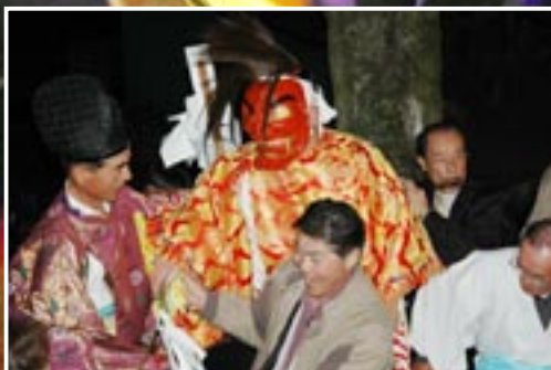
↑鏡畑神楽（鏡畑公民館）