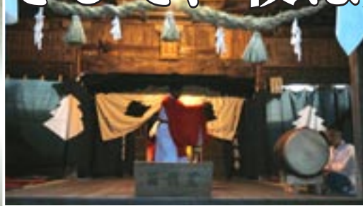
↑光富神楽（徳矢神社）