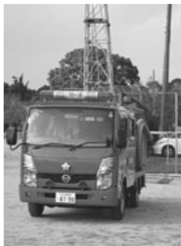
新たに配備される新型車輛

町内の狭い道路にも適した新型車の導入により、今後のみやこ町消防団の活躍が益々期待されます。