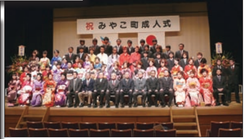
↑犀川地区の新成人たち