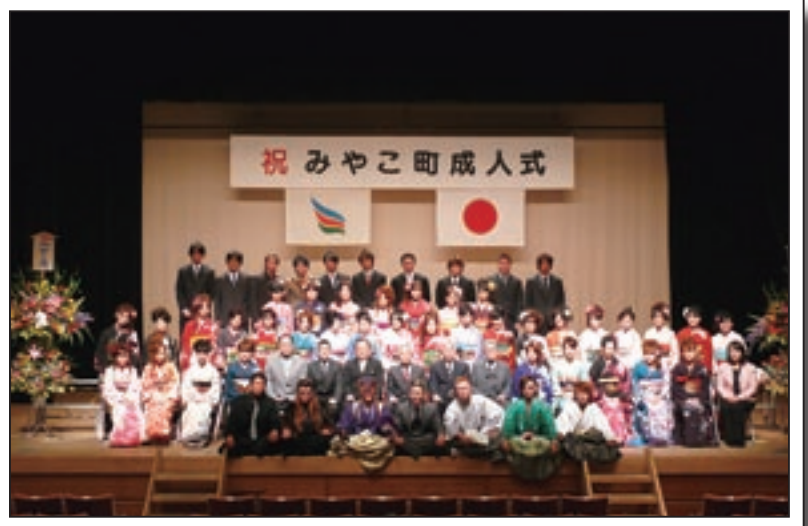
↑勝山地区の新成人たち

色とりどりの衣装に身をまとい、友人や恩師との再会に会場内は楽しい声で湧き上がっていました。