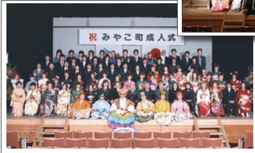
←豊津地区の新成人たち