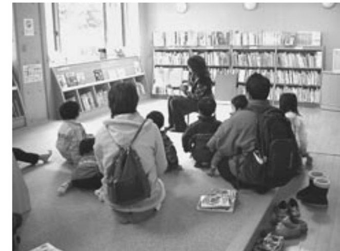
中央図書館でのおはなし会の様子

<土曜日のおはなし会> 4歳くらいから 中央図書館 毎週土曜日 14時30分～ 2月21日は「おひさまの会」 犀川図書館 2月14日 14時～ 2月14日は「きのこの子」 勝山図書館 毎週土曜日 14時30分～ <ひよこのおはなし会> 1～3歳くらい 勝山図書館 2月6日⑩、20日⑩ 10時30分～