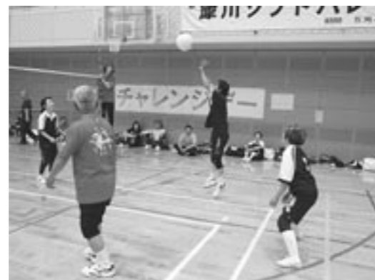
昨年、初勝利の犀川地区での様子

チャレンジデー 2009 が今年も5月に開催されます。みやこ町では、昨年と同様に3地区（豊津・勝山・犀川）で参加する予定です。