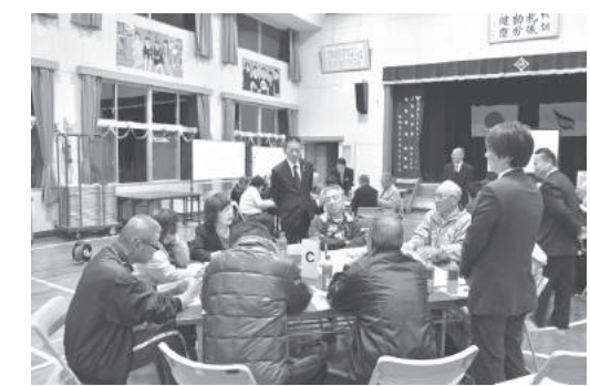
城井地区での意見交換会

A 本町は直接海には面していないが、海洋ごみの多くは河川などを伝い内陸部から出ている。今後問題解決に向け町として取り組みを考えている。次世代を担う町内の児童生徒に環境問題の理解を深めるため小学生には環境教育出前講座を行い、中学生を対象に環境月間に「環境」をテーマにした作文を書くための機会を提供している。今後は不法投棄、ポイ捨ての防止、分別収集の徹底なるべくごみを出さない生活の普及啓発をする。