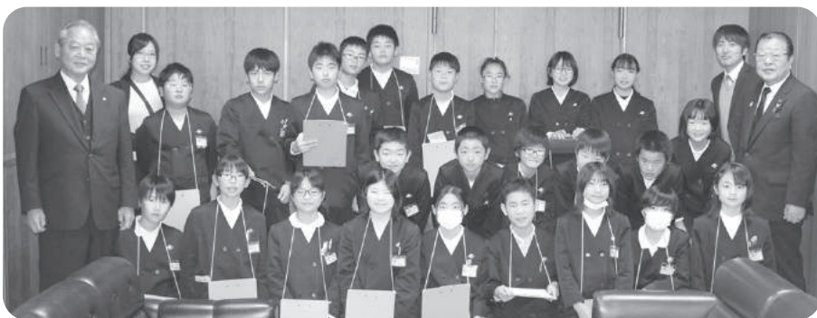
久保小学校6年生 議長室にて

☆今日議会の見学をしました。議員さんの3つの質問に対して、一つずついねいに答えていて、すごいなと思いました。一つ目は、災害対策について、話し合っていて、二つ目は、海洋プラスチックゴミについて、話し合っていました。三つ目は、小学校の跡地について、話し合っていました。こんなに、みやこ町を良くするために、たくさんの事を話し合っているんだなと思いました。今日の話し合いは、議員さんたちだけが、みやこ町を良くするのではなく、わたしたちのために、話し合ってくれている人たちのためにも、私たち一人一人が、みやこ町について、考えていく必要があるなと思いました。この話し合いを聞いて、自分たちの生活に活かしていきたいです。