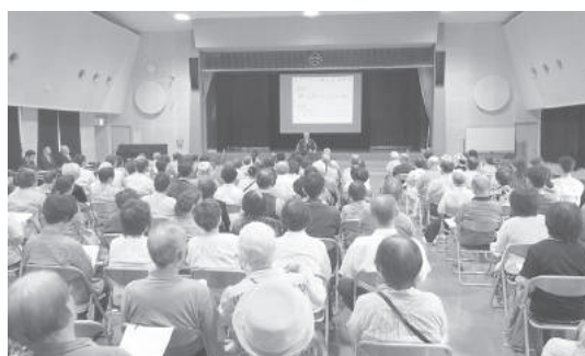
豊津公民館で開催された人権啓発講演会