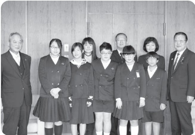
城井・上高屋小学校6年生 議長室にて

12月5日から23日までの会期で開催された12月定例会に城井小学校・傍聴に来ました。子どもたちの目に議会はどのように映ったのでしょうか。