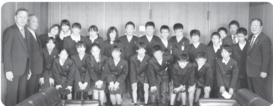
祓郷小学校6年生 議長室にて

☆私は、議会傍聴に行つて、住民の暮らしやすい町にするために、議員さんが、質問をしていたりして、とてもおどろきました。日本各地で高れい化が進んでいることを受けて、高れい者が暮らしやすい環境にするために、各地に研修に行つていて、すごいなと思いました。社会で町づくりの勉強をした。町の人々の声・願いを聞いて、議会で話し合う流れを実際に見ることができて、とても良かったです。