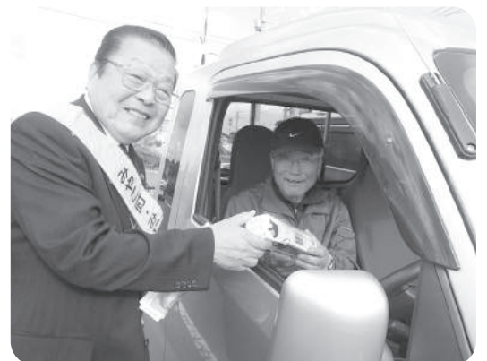
人権週間街頭啓発 (国府の郷)