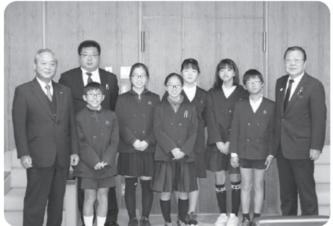
柳瀬小学校6年生 議長室にて

☆私は、議会傍聴に初めて行って、たくさんの方が一生けん命に話し合っている姿を見て、集中力におどろきました。