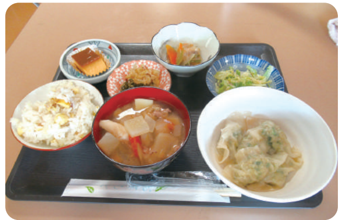
水餃子と栗ごはん (第14回のメニュー)

次回(第16回)は、2月22日に行い ます。 メインメニューはカレーです。 食材の寄付も随時受けつけています。 ご協力をお願いします。