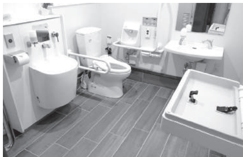
伊良とびあ公園のトイレ

※オストメイトとは、人工肛門や人工膀胱を病気や事故でやむなく造設した人を言います。