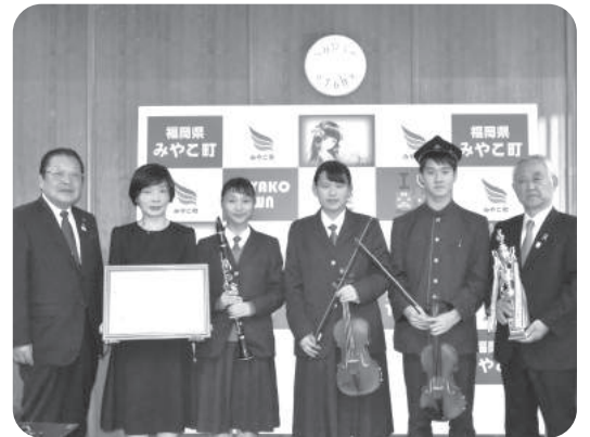
表敬訪問 全国高等学校総合文化祭高知大会出場決定 (育徳館高校)