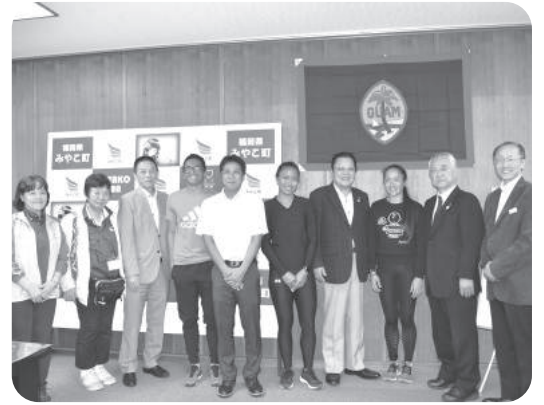
表敬訪問 ONOC陸上強化選手事前キャンプ終了