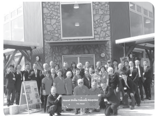
ハワイ島福岡県人会交流会