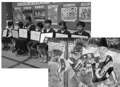
▲過去のまつりの様子(上:表彰記念撮影[令和元]/下:絵画コンクールグランプリ作品[令和4])