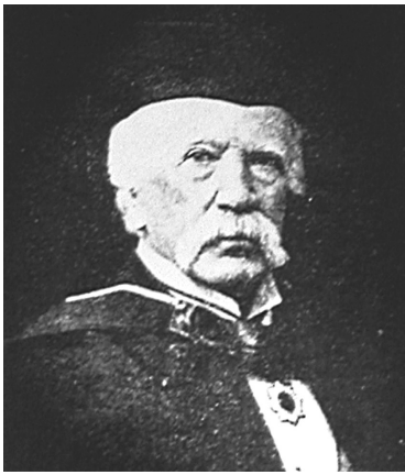
ウィリアム・ガウランド(1842~1922)

明治16年(1883)にイギリス人、ウィリアム・ガウランドがみやこ町勝山黒田にある「綾塚古墳」で実施した測量調査から本年10月17日で140年の節目を迎えます。彼は明治初期の政治的に不安定な時期にも関わらず、みやこ町勝山まで足を運び、調査を行っています。またこの時に作成された石室実測図面が現在、イギリスの大英博物館に収蔵されています。近年、彼が残した調査記録や大英博物館収蔵資料をもとに、調査の日時やルートを復元することができました。今回は、140年前に彼がみやこ町で行った古墳調査を