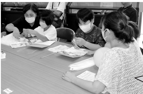
▲ミニ標本箱づくりに熱心にチャレンジする子どもたち 夏休みの自由研究にぴったりの教室となりました