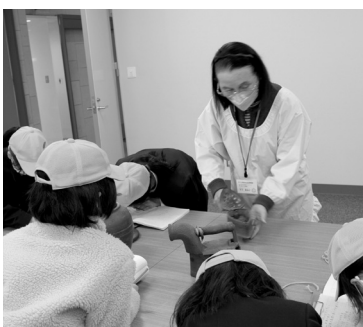
▲ボランティア活動(ワークと称した学び活動サポート) 「昔のくらしと道具」学習で古い道具の実演解説