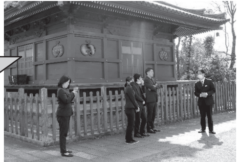
▲巨石古墳や三重塔など古代の技術のすばらしさを見学していただきました。

4月15日(土)・16日(日)、勝山黒田にある黒田神社の神幸祭で町指定文化財「黒田楽」が奉納されました。コロナウイルスにより3年間中断したため、練習には奉納経験者の中・高校生も指導に協力していただき、見事に復活することができました。